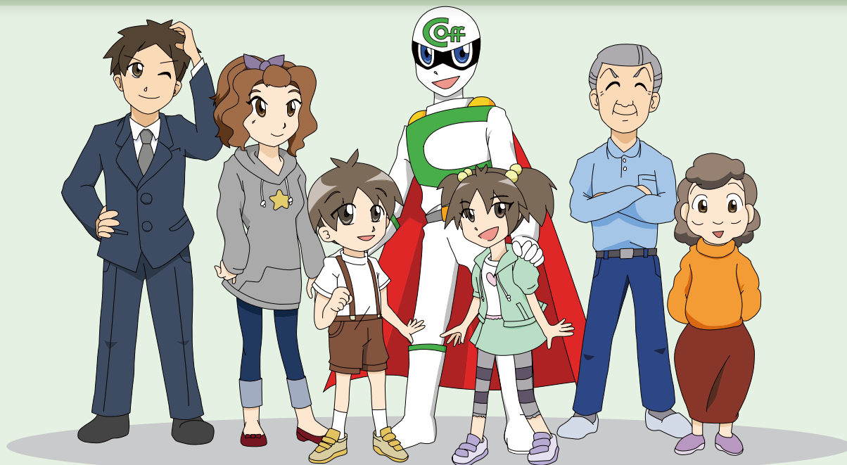
クーリング・オフマン (中央)