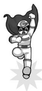
クーリング・オフマン