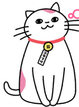
日本行政書士会連合会公式キャラクター ユキマサくん