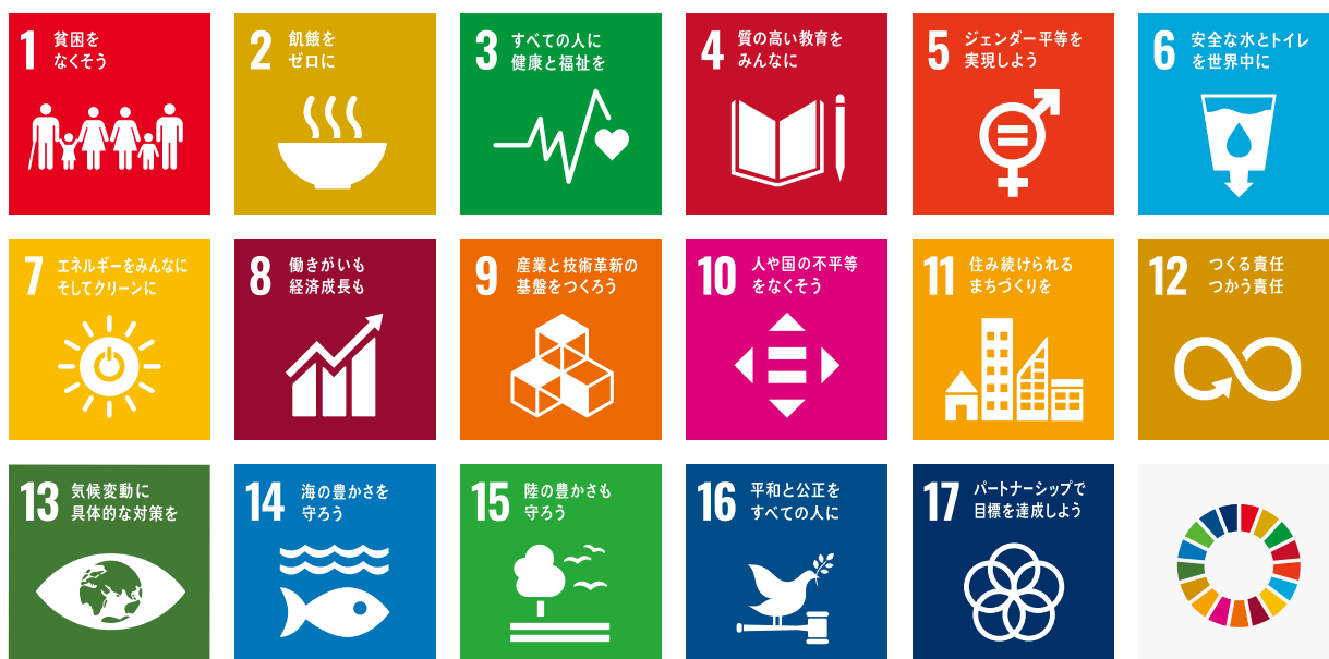
SDGs ロゴ・17の目標のアイコン (国際連合)